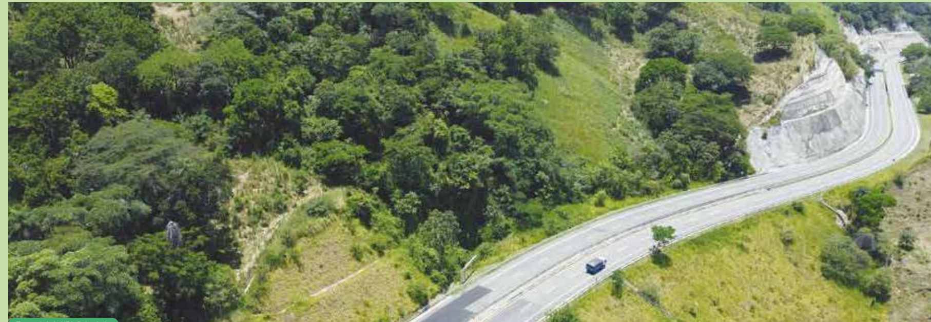
Tramo 1 de la UF1, Bolombolo.

Con este enfoque integral, COVIPACIFICO transforma la movilidad, conecta regiones estratégicas y promueve el desarrollo sostenible, reafirmando su compromiso como un agente clave en la infraestructura y el progreso de Colombia.