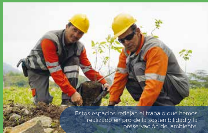
Estos espacios reflejan el trabajo que hemos realizado en pro de la sostenibilidad y la preservación del ambiente.

Es importante destacar que en 2023 sembramos más de 3.550 árboles de especies nativas y con alto valor de conservación como parte de las labores de resiembra en el marco de las compensaciones ambientales del proyecto.