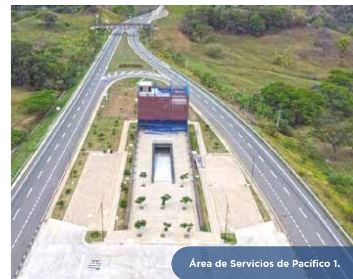
Área de Servicios de Pacífico 1.