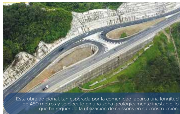
Esta obra adicional, tan esperada por la comunidad, abarca una longitud de 450 metros y se ejecutó en una zona geológicamente inestable, lo que ha requerido la utilización de caissons en su construcción.

Además, se ha avanzado en la construcción del retorno 2 en el sector de “Las Areneras”. Esta obra, que implica un manejo minucioso y representa un desafío de ingeniería, se encuentra en progreso. Destacan las obras en taludes, algunos de ellos alcanzan alturas superiores a los 130 metros.