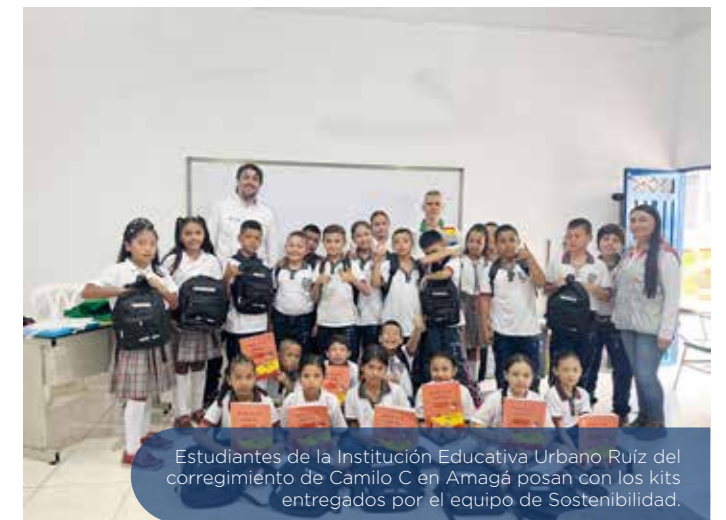
Estudiantes de la Institución Educativa Urbano Ruíz del corregimiento de Camilo C en Amagá posan con los kits entregados por el equipo de Sostenibilidad.