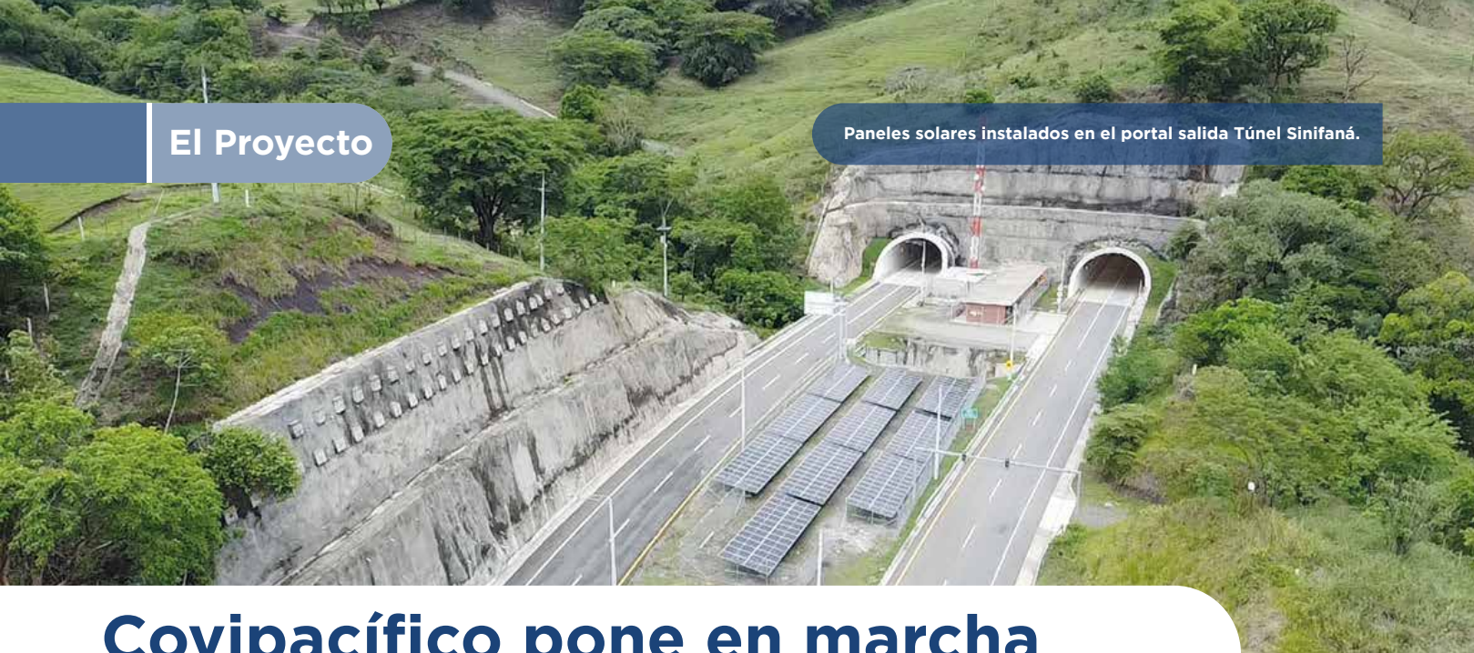
Paneles solares instalados en el portal salida Túnel Sinifaná.