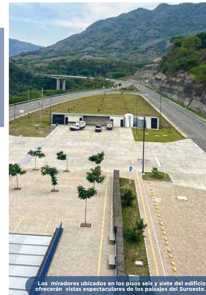
Los miradores ubicados en los pisos seis y siete del edificio ofrecerán vistas espectaculares de los paisajes del Suroeste.