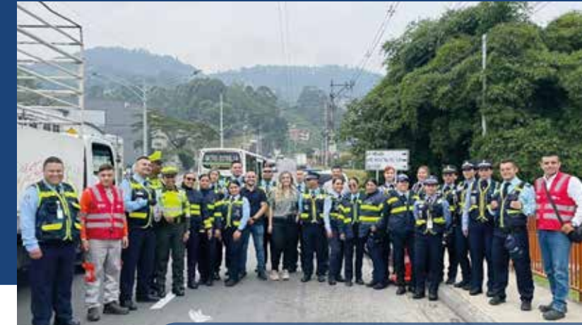
Covipacífico y las instituciones municipales impulsan una campaña de concientización vial.

Esta importante iniciativa contribuye significativamente a la reducción de accidentes de tránsito.